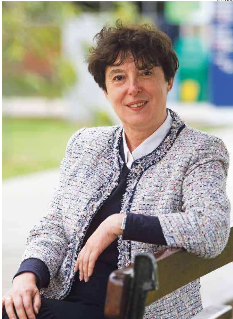
GEÓGRAFA. La Dra. Czerny visitó la PUCP para dictar una conferencia sobre espacios urbanos en transición.

Desde hace 20 años aparecen nuevos fenómenos que provocan fragmentación del espacio urbano, la cual obedece a distintos factores. Una parte es la fragmentación de la sociedad, que ocasiona que varios grupos sociales prefieran separarse también dentro del espacio urbano. Por eso aparecen, tanto en las ciudades latinoamericanas como en las europeas, los llamados barrios cerrados. Por supuesto que esto está relacionado con la falta de protección por parte de las autoridades locales de todas partes del mundo, pero también con el crecimiento de la clase media, que se siente a veces insegura y se quiere separar de los demás, especialmente de la clase popular o de los inmigrantes que vienen a las